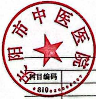
表七、一般公共预算基本支出情况表