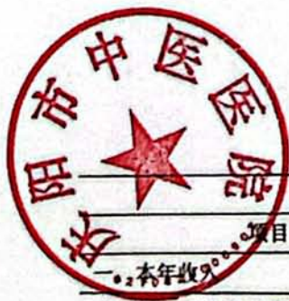
表四、财政拨款收支总体情况表