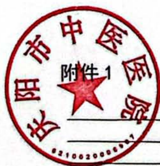
表一、部门收支总体情况表